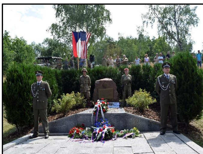
Teplice – Písečný vrch

Psal se pátek 21. července 1944, když v ranních hodinách ze Stornary a dalších jihoitalských vojenských základen 15. letecké armády USAAF, vzlétlo 362 bombardérů. Cílem bylo bombardování areálu chemického komplexu Sudetenländische Treibstoffwerke /STW/ v Záluží u Mostu a dalších vojenských objektů.