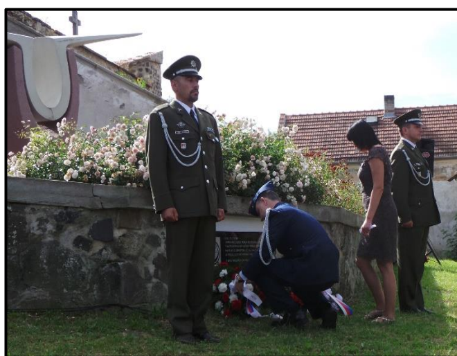
Mukov – Hrobčice